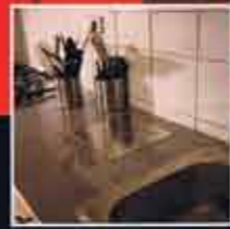
Plan de travail

La gamme Résinence Color®, Résinence Déco® basée sur des résines sans solvants, vous permettra de laisser libre cours à vos envies de décoration sur tous types de supports : les sols, les murs, le mobilier, l'émail et l'inox et même les plans de travail. Avec un choix de 26 couleurs et des résines de finition à l'aspect mat, brillant ou satiné, profitez d'une vraie liberté de création ! D'application facile, vous découvrirez également les qualités exceptionnelles de résistance à l'abrasion et d'étanchéité qui donnent un avantage inégalé à nos produits.