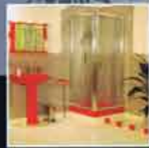
Email & Inox