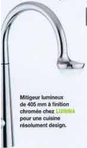
Mitigeur lumineux de 405 mm à finition chromée chez LUMINA pour une cuisine résolument design.