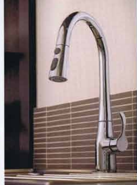
Mitigeur évier bec haut à douchette avec éclairage intégré Eve chez GROBALPE.