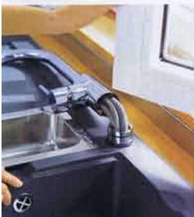
ils S Variarc de HANSGRÖHE. Le positionnement ée est variable. À partir de 361 €.