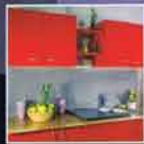
Mural & Mobilier