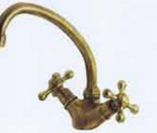
Mélangeur finition vieux bronze chez GROSSETTE. 131 €.