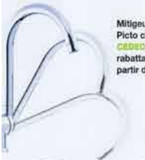
Mitigeur Alterna Picto chez CEDEO à bec rabattable. À partir de 256 €.