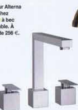
Chez JADO avec ce mélangeur évier Cubic, orientable à 360°, finition chromée. 804 €.